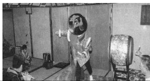
おどりを練習する牛久保の子ども